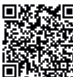
aplikace ke stažení